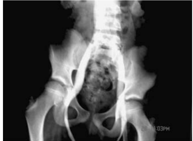
Figura 4. Flebografía a nivel de pelvis donde se logra demostrar la presencia de reflujo hacia la vena femoral derecha al momento de realizar compresión.