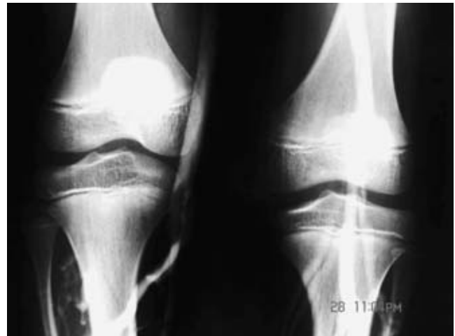
Figura 5. Se observa miembro pélvico derecho sin paso del medio de contraste al sistema venoso profundo.

geográficos de color rojo vinoso de predominio unilateral observándose en cuello, tronco y extremidades superiores e inferiores del mismo lado, aunque puede pasar desapercibida en el nacimiento, se va haciendo más notoria con la edad y con el crecimiento óseo. Se puede localizar en cualquier región, pero son más frecuentes en las piernas, regiones glúteas, abdomen y porción inferior del tronco, predomina la distribución unilateral aunque el compromiso bilateral no es raro. 7