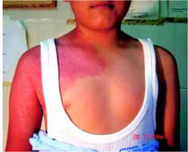
Figura 1. Mancha color rojo vinoso que ocupa parte del cuello, tórax, brazo derecho, muslo y pierna del lado derecho.

El síndrome de Klippel-Trenaunay fue descrito en 1900 por dos investigadores franceses, es un trastorno mesodérmico congénito raro de etiología desconocida y de expresión variable con probable alteración a nivel del gen VG5Q, el cual es el encargado de controlar el crecimiento de los vasos sanguíneos. En algunas ocasiones pueden haber individuos portadores de una mutación paradominante que se transmite a su descendencia, pero si ocurre una segunda mutación somática, se forma un conjunto de células mutantes donde se pierde