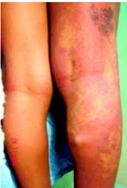
Figura 3. Vista posterior de ambos MP, obsérvese el reforzamiento vascular venoso importante en el lado derecho, así como diferencia en el nivel de los pliegues de ambos miembros pélvicos y discrepancia en el grosor (diámetro) de ambas extremidades en comparación con el lado izquierdo.