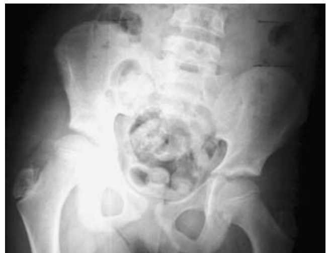
Figura 8. Se toma radiografía A-P de pelvis con el paciente en posición de pie, en donde se observa la diferencia de altura de crestas ilíacas y en la ortomedición se obtiene un valor diferencial de 3.4 cm.