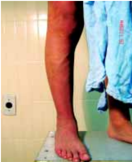
Figura 2. En el MPD también se observa aumento de la trama venosa en la cara posterior lateral externa de la pierna, muslo y en la región dorsal del pie.

En este paciente es clásica la lesión cutánea en el lado derecho (Figuras 1, 2 y 3), la cual es de bordes